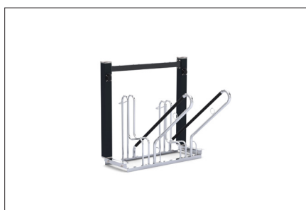
Model FUN 502 BN 230 V

Modulární konstrukce Metadesign, která umožňuje instalaci elektrických zásuvek a dalšího příslušenství, je výjimečnou, robustní a patentovanou platformou. Je vyrobena převážně z práškově lakovaného hliníkového profilu o rozměru 80x80 mm v RAL 7016 (antracitová), lakované a nerezové oceli. Při výrobě není použito svařování ani jiných technologií, které by doživotně spojily použité prvky. Každý díl konstrukce může být v případě potřeby kdykoliv jednoduše vyměněn. Splňuje tedy následující požadavky EU na opravitelnost.