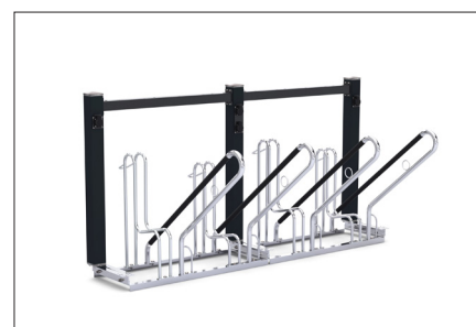
Model FUN 504 BN 230 V