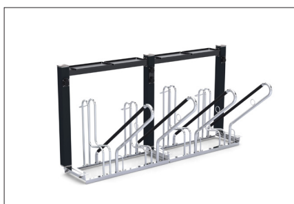
FUN 504 BN 230 V (Příslušenství: 4 ks odkládacích nerezových ploch)